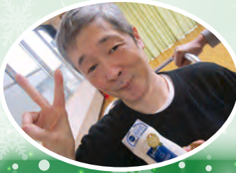
良いものが選べたよ!