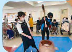
つくたてのお餅はやはり格別で美味しいね