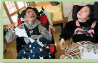
仲良く紙を引っ張り合って 干切ります