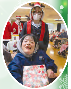
当選したご利用者はインターアクト部の皆さんに誘導して頂き、好みのプレゼントを選ばれました。