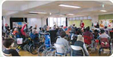
クイズで大きく手を挙げておられました。