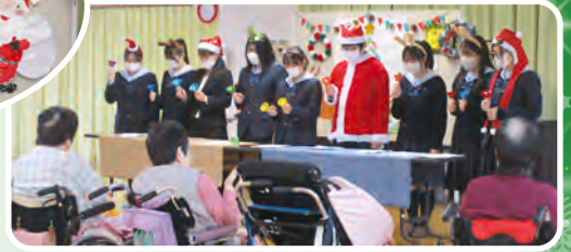
曲に合わせて歌を口ずさまれました。