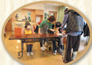
いらっしゃいませ