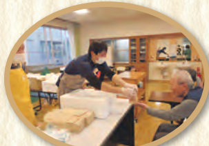
ありがとうございました