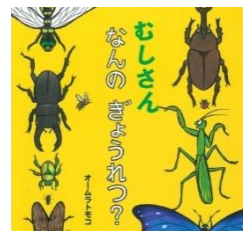
おしさんなんのぎょうれつ？